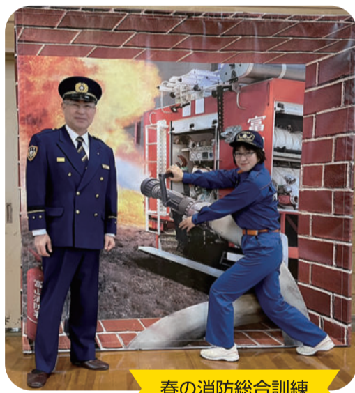
春の消防総合訓練