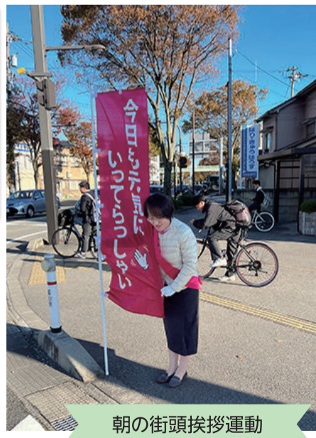
朝の街頭挨拶運動