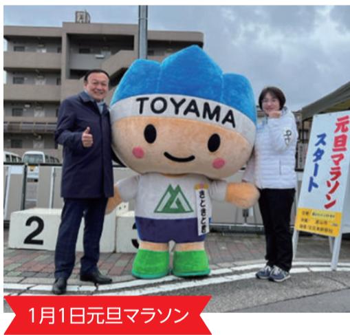
1月1日元旦マラソン