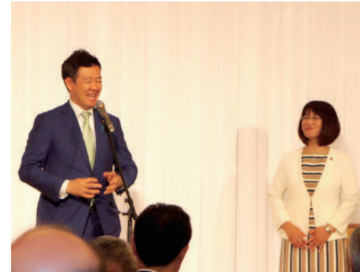
衆議院議員 田畑 裕明 代議士

平成 29 年 7 月 9 日(日) 第 1 回たかたまり後援会総会がグランテラスにて開催されました。